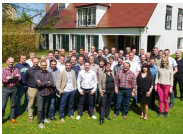
Mitarbeiter abat+ GmbH, St. Ingbert

Der Vorteil für unsere Kunden ist die langjährige Erfahrung unserer Automotive Experten im Supply-Chain-Management, in der Distributions-, Produktions- und Beschaffungslogistik sowie in der Projektsteuerung und in der Instandhaltung. Auch in Sachen Rechnungswesen, Controlling und Business Information profitieren Hersteller und Zulieferer vom abat-Knowhow. Ein weiterer Vorteil unseres Angebots: Wo andere SAP-Automotive Spezialisten in der Fertigung aufhören, schließen wir die Lücke mit der Software Lösung PLUS. Dieses Produkt basiert auf SAP Technologie und ist das weltweit einzige Standard Produkt für die Steuerung des gesamten Produktionsprozesses. Besonders hervorzuheben ist das integrierte Qualitätsmanagement, das durchgängig alle Prozesse in der Fertigung erfasst, steuert und absichert. PLUS wird seit Jahren als weltweite Standardsoftwarelösung im gesamten Bereich der Mercedes-Benz-Personenwagen sowie bei Smart und Qoros zur Fertigungssteuerung der Montagewerke und inzwischen sogar für ein Komponentenwerk eingesetzt. Auch der chinesische Fahrzeughersteller Qoros setzt in der Steuerung seiner kompletten Produktion auf die Software unseres Unternehmens.