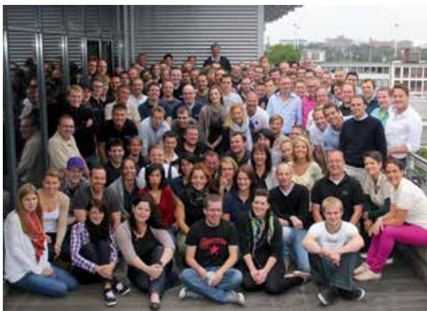
Mitarbeiter abat AG, Bremen

abat ist seit vielen Jahren eine erfolgreiche Symbiose aus IT- und Prozesswissen. Mit modernsten Projektsteuerungsmethoden, effizienten SAP-Prozessabläufen kundenspezifischen add-ons sowie der einzigartigen MES-Softwarelösung PLUS realisieren wir erfolgreich Projekte für internationale Automobilhersteller und Zulieferer. Unser ganzheitliches Branchenwissen über die komplette Wertschöpfungskette hilft unseren Kunden, neue Potentiale zu erschließen und sich im internationalen Wettbewerb weiter zu differenzieren.