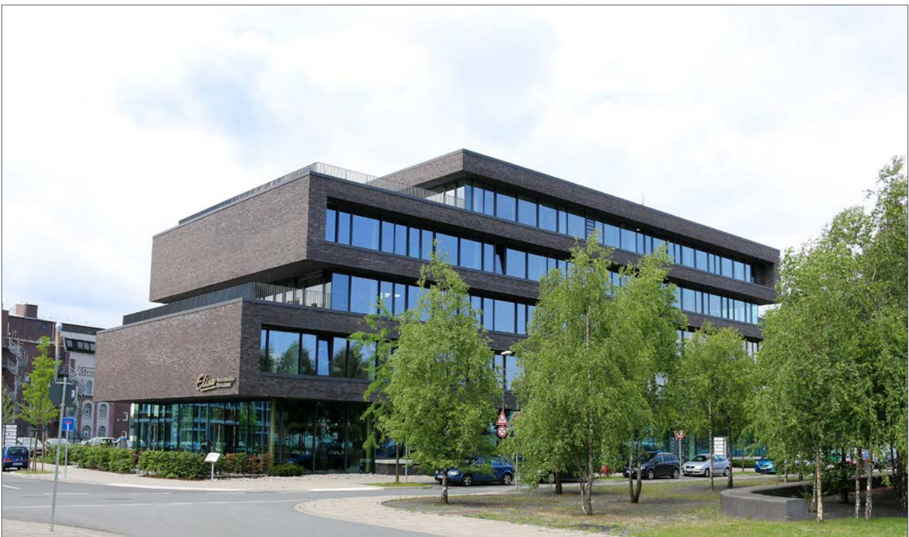
Hauptsitz der abat

In seiner Größenklasse wurde abat 2017 erneut von TopJob als einer der besten Arbeitgeber Deutschlands ausgezeichnet. Das Unternehmen trägt zudem die Gütesiegel TOP-Company und OPEN-Company der Jobbewertungsplattform kununu.com.